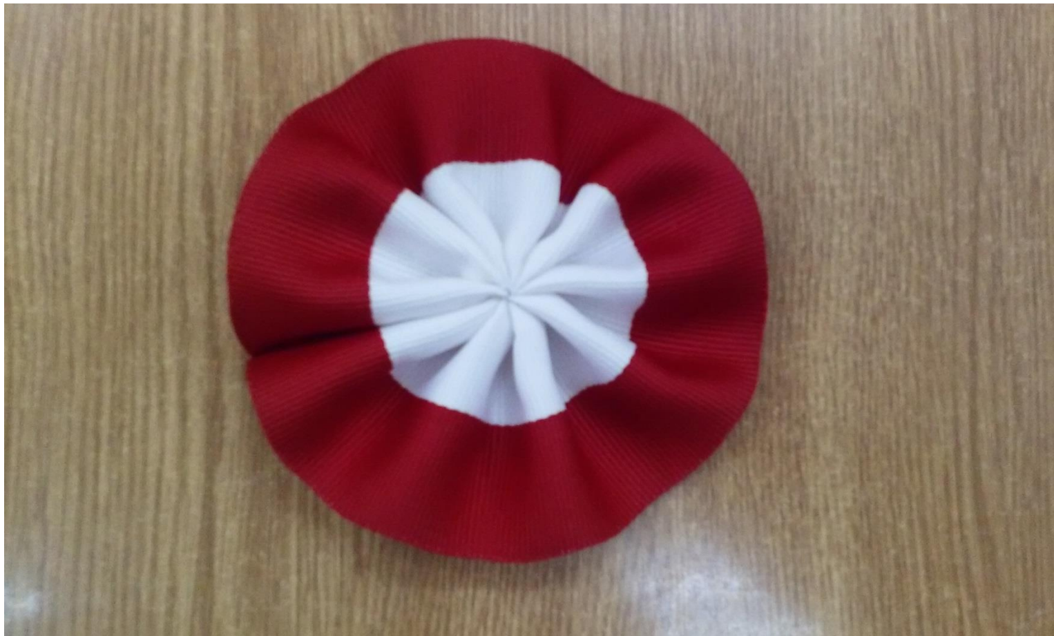
Prawa strona gotowego kotylionu