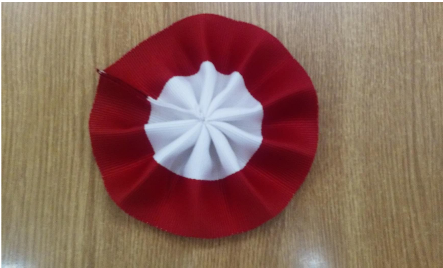
Lewa strona gotowego kotylionu